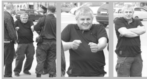
● НА ФОТО: ПАНТОМИМА «ПУЛЕМЕТЧИК»

В день 22 апреля, когда коммунисты проводили традиционное возложение цветов к памятнику В.И. Ленину, журналист наблюдал вызывающее поведение «человека, похожего на сотрудника полиции». Находясь в группе сотрудников правоохранительных органов, «приписанных» к наблюдению за пикетом, человек в штатском в красноречивых жестах показал своим зрителям в форме, как он расстреливает из воображаемого станкового пулемета собравшихся на возложение цветов.