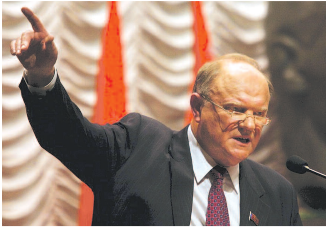
● НА ФОТО: ПРЕДСЕДАТЕЛЬ ЦК КПРФ, ДЕПУТАТ ГОСУДАРСТВЕННОЙ ДУМЫ ГЕННАДИЙ ЗЮГАНОВ

Мы, коммунисты, предлагаем другой путь развития образования. Мы настаиваем, чтобы премьер-министр вынес наш проект закона об образовании — «Образование для всех» — на заседание Правительства. Здесь в Думе его обсуждали лучшие ученые и специалисты, а Академия образования подготовила