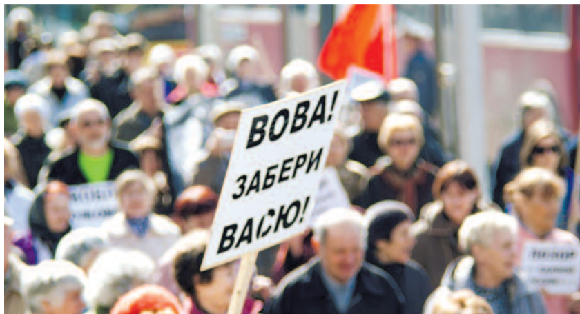
● НА ФОТО: НАРОДНОЕ ОБРАЩЕНИЕ К ПРЕЗИДЕНТУ

Чисто теоретически, прокурор области может еще обратиться в порядке прокурорского надзора в Генеральную прокуратуру и попросить дополнительно рассмотреть вопрос в президиуме суда. Однако возможность такого развития