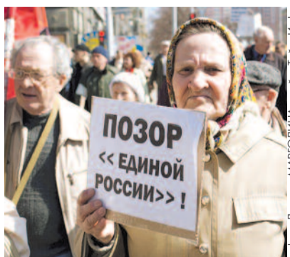
● НА ФОТО: НЕТ — ПОЛИТМОНОПОЛИИ!

Сейчас партия власти — это рост цен и тарифов ЖКХ, это отмена безлимитного проезда для пенсионеров, это тотальная коррупция и диктатура чиновников, это попрание демократических прав и свобод. Сегодня правящая партия представляет опасность для будущего развития нашей страны. Создадим единый фронт против политической монополии «Единой России»!